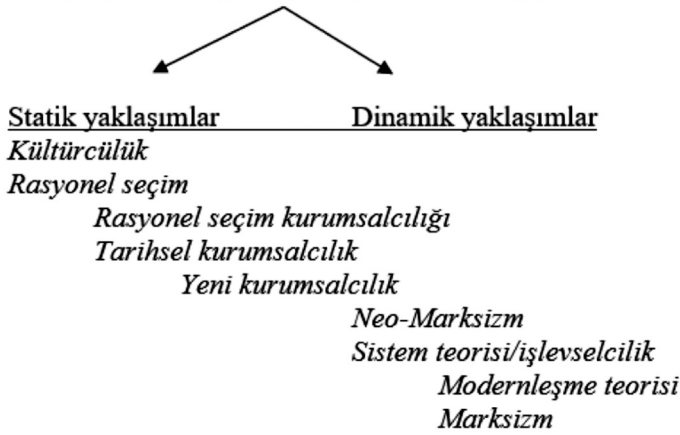
Figür 1: Karşılaştırmalı Siyaset Yaklaşımlarında Değişim İmkânı

Değişim mümkün mü, mümkünse ne kadar mümkün sorularının ardından bir diğer sınıflandırma da değişimin doğrultusu konusunda yapılabilir. Değişim zaruri olarak iyiye veya kötüye doğru mu olur? Bu bakımdan sistem teorisi, modernleşme teorisi, (en azından Inglehart'ın versiyonunda) kültürcülük, RS ve Marksizm değişimin ne kadar mümkün olduğu konusunda anlaşamaları da değişimi determinist bir tarzda iyiye dönük görürler. Neo-Marksizm ve RS kurumsalcılığı ise ilerlemeci uca yakın olmakla beraber spektrumun en ucunda yer almazlar. Determinist bir kötüye, geriye gidiş öngören bir yaklaşım ise bulunmamaktadır. Bu yaklaşımların değişim konusunda öngördükleri doğrultular Figür 2'de görülebilir.